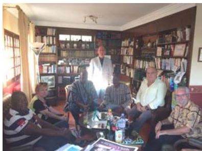
Réception au Consulat