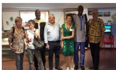
Visite de la maison du Lac de Saint Cassien