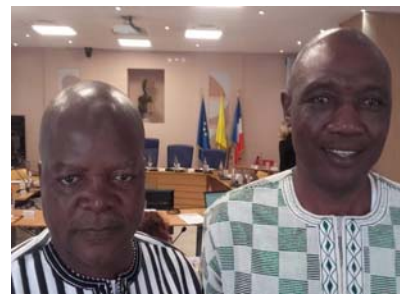
Participation au Conseil Municipal de Villeneuve Loubet