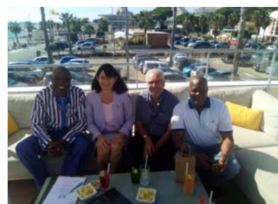
Entretien avec Laurence Trastour députée de la 6ème circonscription