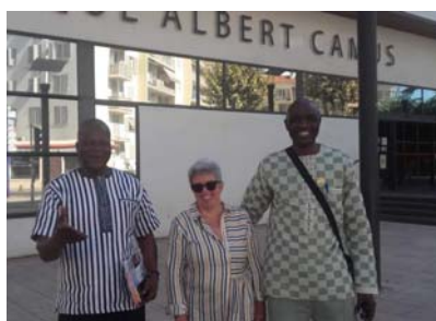
Visite de la médiathèque Albert Camus d'Antibes