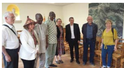
Réception officielle en Mairie de Saint Vallier de Thiey