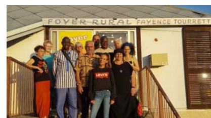
Réception par le Foyer Rural de Fayence-Tourrettes