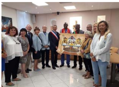
Réception officielle en Mairie de Villeneuve-Loubet