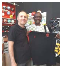
Photos prises lors de la visite de la délégation Burkinabé en France