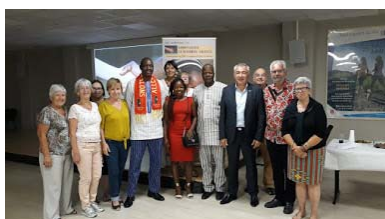
Rencontre avec la Maire de Saint Laurent du Var lors de la soirée organisée par Le Neemier