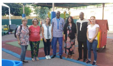
Visite d'une crèche de Cagnes sur Mer