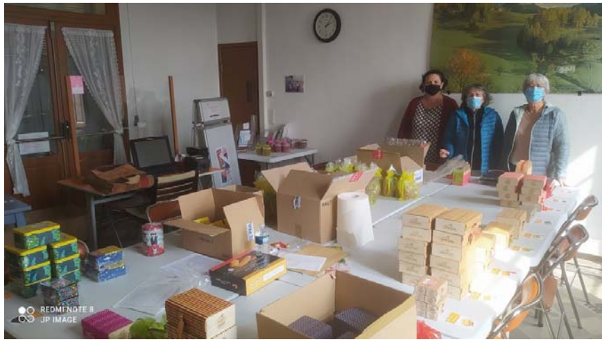
Une partie de l'équipe préparant les commandes

La prochaine campagne de chocolats solidaires aura lieu pour les fêtes de Noel les catalognes de commandes seront disponible dès le début du mois d'octobre 2021.